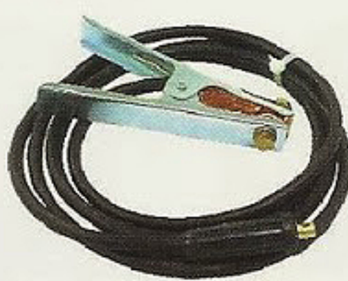
300A+16mm 2 x3m