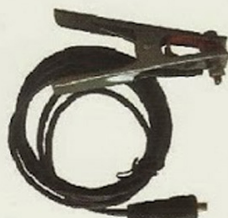
300A+6mm 2 x3m